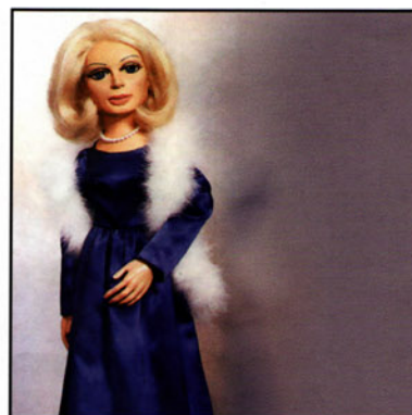
De naam Lady Penelope ontleent het designersduo onder meer aan de dame uit de poppenserie The Thunderbirds.