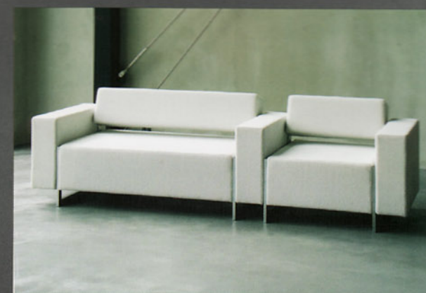
De meubels van de Box-serie kunnen geschakeld worden

Box van Inno, ontworpen door Harri Korhonen, heeft een zeer strakke lijnvoering. Interessant aan het ontwerp is dat de fauteuils geschakeld kunnen worden met tweezitmeubels en dat er tevens gekozen kan worden om wel of geen rugleuning toe te passen. Verschillende combinaties zijn mogelijk. Voor de afwerking is er de keuze tussen stof van Kvadrat of Inno, leer van Elmosoft of een eigen stof. Korhonen heeft voor Inno, waarvan M4p2 de handelsagent is, ook de CD Lobby ontworpen. Gebogen en rechte elementen kunnen in dit ontwerp aan elkaar geschakeld worden tot een zitmeubel dat zeer geschikt is voor wachtruimten.