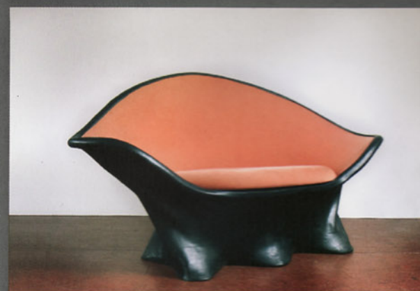
Topdesign gebaseerd op hergebruik van rubber

De Eindhovense Design Academy organiseerde in Milaan een grote overzichtstentoonstelling ter ere van zijn 60-jarig bestaan. Nederlandse meubelontwerpers lijken op die tentoonstelling meer dan ooit te balanceren op de grens tussen kunst en design. Voorbeelden zijn de meubels van Studio Job, het doolhof met gehaakte sculpturen van Marcel Wanders en de poëtische werken van Ineke Hans.